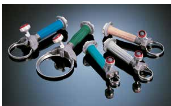
Cuchillos eléctricos Whizard Serie II