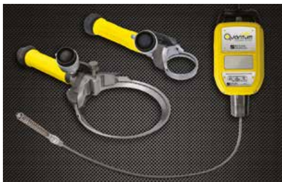
Cuchillos eléctricos Whizard Quantum