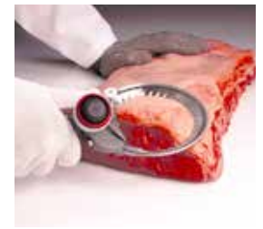
Pulido del despiece de vacuno