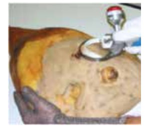
Limpieza externa de jamones curados