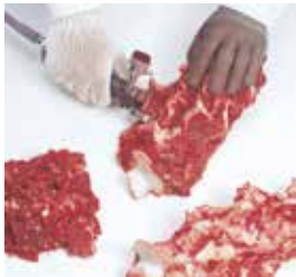
Descarnado de huesos, espinazos, etc.