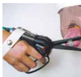
Corte de clips en fábricas de embutidos