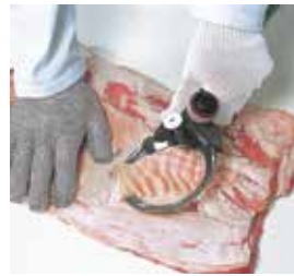
Repaso de pancetas