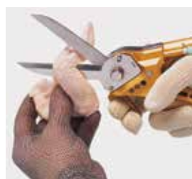
Sacrificio y despiece de aves en industrias avícolas