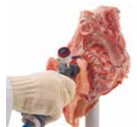
Descarnado de carcasas de pavo