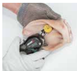
Corte de crotales