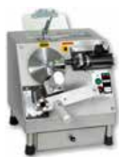
Afladora automática AutoEdge