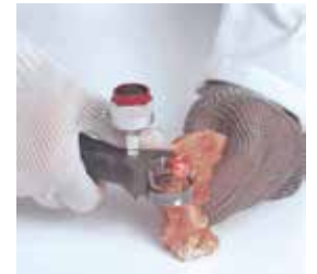
Deshuesado del contramuslo de pollo