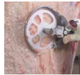
Desgrase de la canal de vacuno en caliente