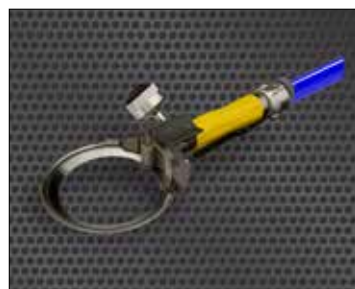
Whizard neumático Quantum