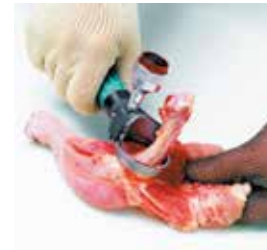
Deshuese de muslos de pollo