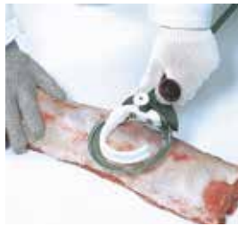
Desgrase de lomos y chuleteros