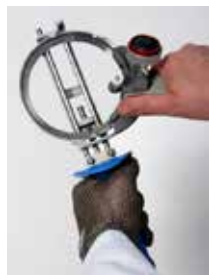
Afilador EdgeMaster EZ