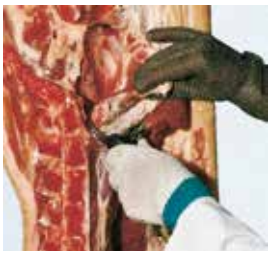
Extracción del solomillo de la canal de porcino