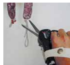
Corte de hilos en fábricas de embutidos