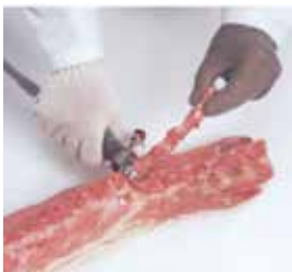
Extracción del cordón de huesos de porcino