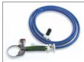
Whizard neumático Airmax Mach 3