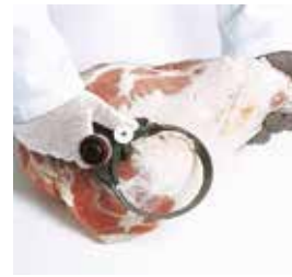
Desgrase de jamón y paletas