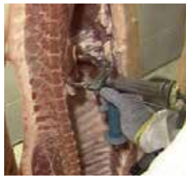
Extracción del diafragma de la canal de porcino