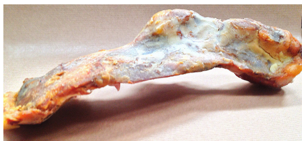
Sin hueso puente