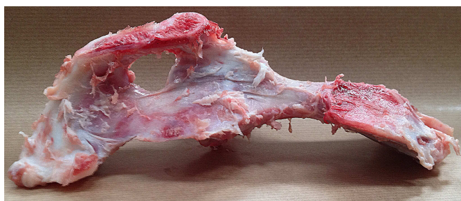
Con hueso puente