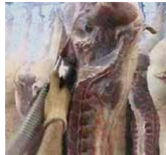
Aspiración de médula y restos de manteca en la canal de porcino