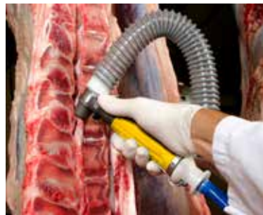
Aspiración de médula de vacuno después del esquinado