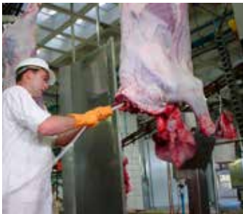
Aspiración de médula de vacuno antes del esquinado