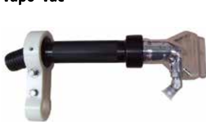
Diseñado para la reducción microbiológica en las canales de vacuno, porcino y ovino