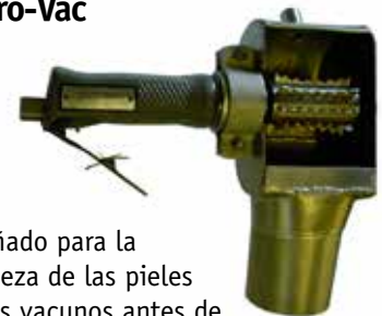
Diseñado para la limpieza de las pieles de los vacunos antes de realizar los cortes de las operaciones de desuello