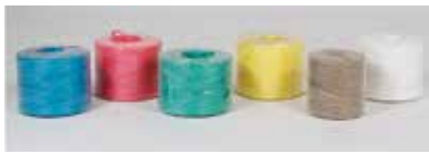
Bobinas de hilo para atado