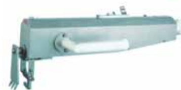
Deshuesador de paletas