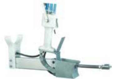
Deshuesador de pancetas