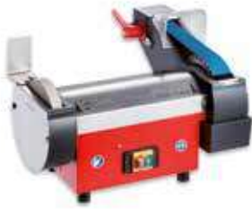
Afiladora con agua SM-140