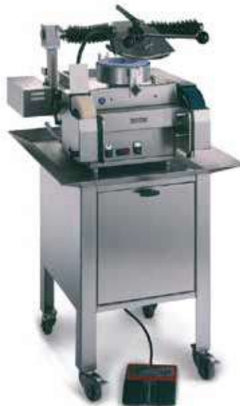
Afiladora de cuchillas circulares y de cutter SM-200 TE