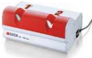
Afiladora y repasadora RS-150 DUO