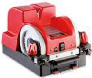
Afiladora y repasadora con agua SM-110