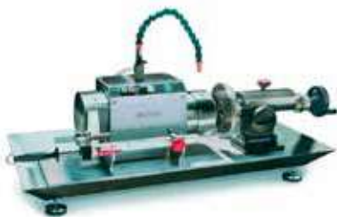
Afiladora de cuchillas y placas de picadora KL-205