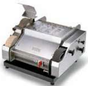
Afiladora con agua SM-160 T