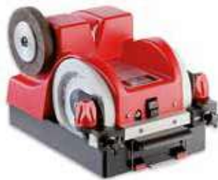
Afiladora y repasadora con agua SM-111