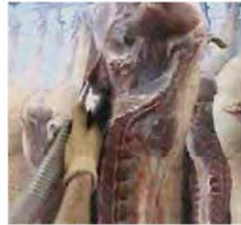
Aspiración de médula y restos de manteca en la canal de porcino