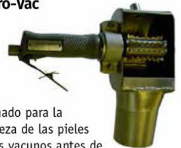
Diseñado para la limpieza de las pieles de los vacunos antes de realizar los cortes de las operaciones de desuello