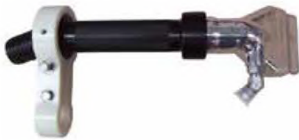
Diseñado para la reducción microbiológica en las canales de vacuno, porcino y ovino