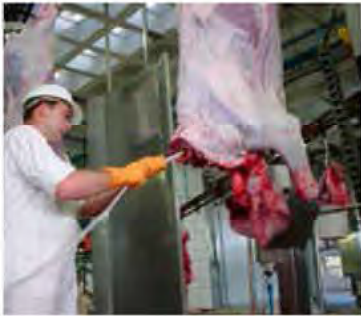
Aspiración de médula de vacuno antes del esquinado