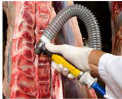
Aspiración de médula de vacuno después del esquinado