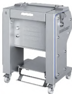
ASP 460 Descortezadora manual para piezas redondas como paletas, jamones y codillos con ancho de corte de 460 mm