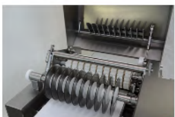
Rodillo especial para corte control de papadas