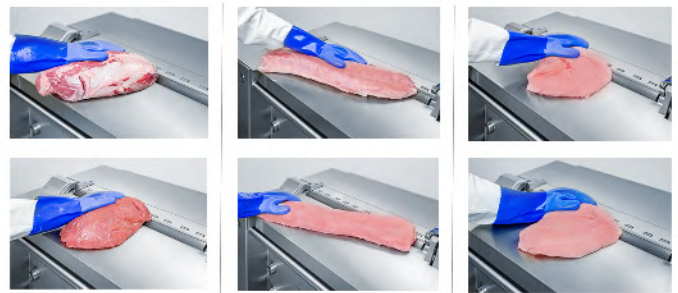
AMS 533 Desveladora que permite el desvelado de todo tipo de piezas de carne fresca e incluso de queso gracias a su robustez