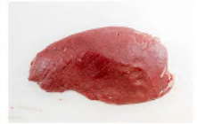
AMS 533 TWIN Desveladora combinada, especialmente indicada para procesar piezas con tendones fuertes y posterior desvelado