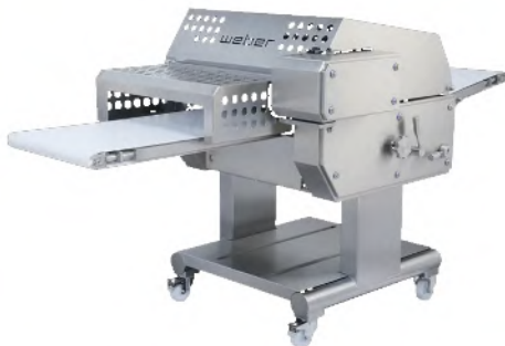
Descortezadora ASW 560 corte y descortezado o aplanado y descortezado, gracias al sistema automático de corte inicial

Las descortezadoras ASB pueden ser montadas sobre chasis especiales para integralas en la línea de proceso