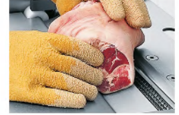
ASB 600 Descortezadora manual/automática con ancho de corte de 400 mm para pequeñas y medianas industrias