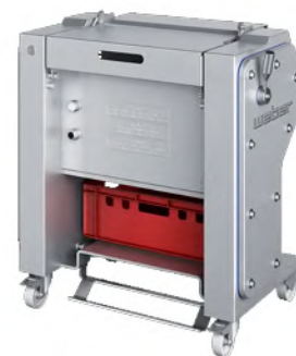
ASP 560 Descortezadora manual con ancho de corte de 560 mm para piezas redondas; ASP 560D para descortezar y desgrasar al mismo tiempo