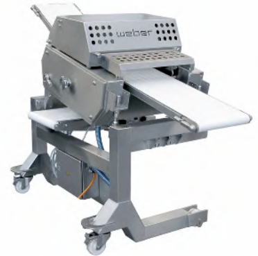
Descortezadoras automáticas ASB de alto rendimiento para salas de despiece. Disponibles con una ancho de corte de 460, 560, 770 mm

Las descortezadoras ASB pueden ser montadas sobre chasis especiales para integralas en la línea de proceso