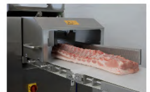
ASD 460 Solución industrial para el desgrasado y descortezado de lomos de cerdo Fácil manejo mediante un panel táctil que permite seleccionar el grosor del portacuchilla para obtener así grosores de grasa homogéneos