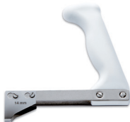
Deshuesador de costillas con cuchilla rígida o flexible 14,16,18 cm