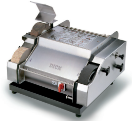
Afiladora con agua SM-160 T